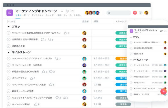
Asana 製品イメージサンプル